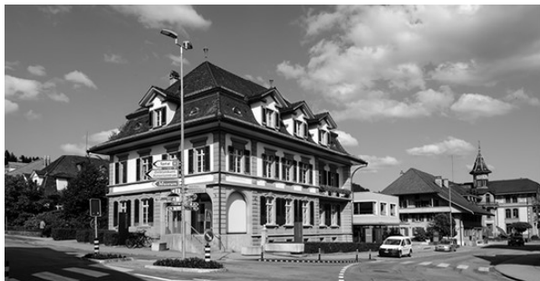
Raiffeisenbank Oberes Emmental Langnau i.E. und Eggwil raiffeisen.ch/oberes-emmental