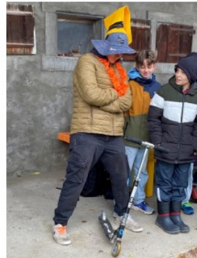
Grumpy betrachtet sein neues Trottnett