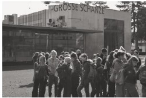
Bezirksanlass 21.10 2023 in Bern