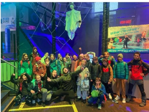
Pfadistufe im Kiddy Dom